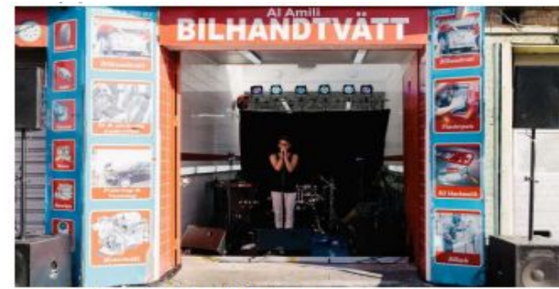
Temporär användning biltvätt som musikscen