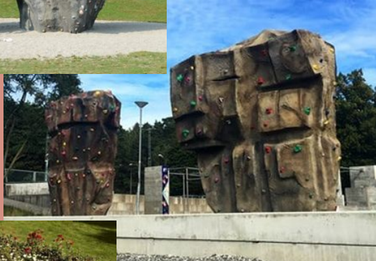
(Södertälje kommun 2016)