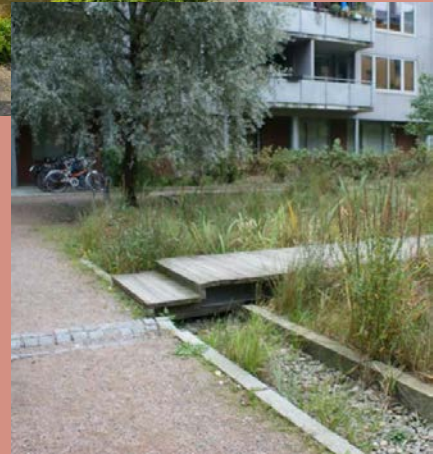
(Olsson & Hansson 2018)