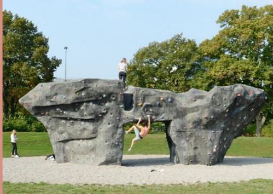
(Kulturportal Lund 2016)