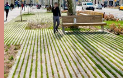
(Benech et al. u.å.)