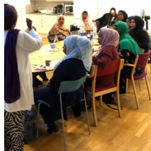
Femton mammor började planera för nattvandringar direkt efter mötet hos Fastighetsägare Sofielund.

Vill du vara med, hör av dig till Fastighetsägare Sofielund!